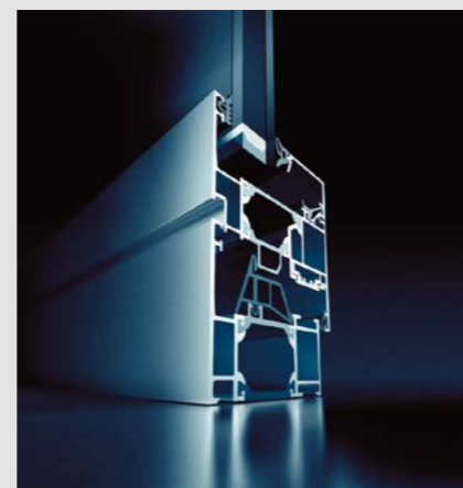
Acento AWS 65

Die wärmegeklämte Weru-Profilserie Acento AWS 65/ AWS 70 Therm überzeugt mit dem umfangreichsten Profilsortiment für alle Fenster- bzw. Element-Typen und diversen Öffnungsarten. Das System eignet sich besonders gut für geschosshohe Ausfachungen, Treppenhauswände und Empfangsbereiche.