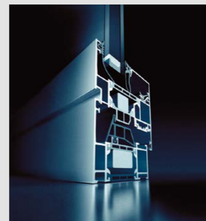
Acento AWS 70 Therm